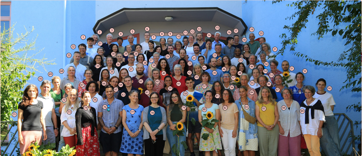
Mitarbeitende der Tübinger Freien Waldorfschule, Kindergarten und Betreuung (07.09.2024)